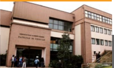
FACULTAD DE CIENCIAS

CAMPUS SAN ANDRÉS ALONSO DE RIBERA 2850 CONCEPCIÓN TEL (56) 41 234 5250 - 41 234 5286 FAX (56) 41 234 5001 ucsc@ucsc.cl